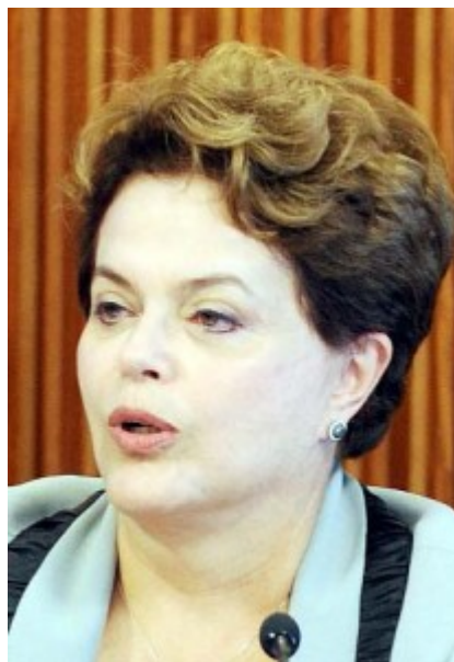
Dilma Rousseff.

SÃO PAULO (ANSA). La presidenta de Brasil, Dilma Rousseff, afirmó ayer su disposición de colocar a los derechos humanos en un lugar central de la política externa, “sin selectividad ni trato discriminatorio”, al recibir una carta de una diputada iraní.